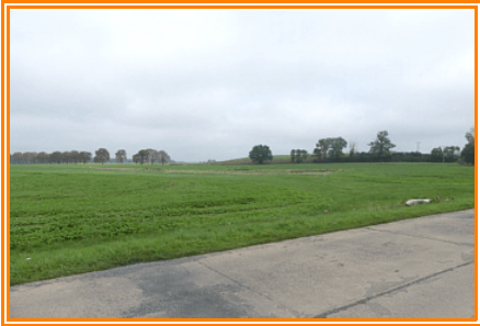
Abb. 8: Blick auf den Klinkenberg nordwestlich von Schwiggerow

Auf der Nordseite von Schwiggerow liegt der bewaldete Tannenberg mit 69,6 m üNN . Nach 800m haben wir Schwiggerow durchlaufen und biegen links ab und gehen die Straße (K24) nach Hoppenrade entlang. Blicken wir hier nach rechts erkennen wir auf der Feldmark eine Erhöhung, den Klinkenberg (51,6m üNN) und an der Landstraße weiter nördlich, einen auffälligen bewaldeten Kegel. Es ist der Girrenberg (57,1m üNN). An dessen Südrand befindet sich auch ein kleiner Parkplatz.