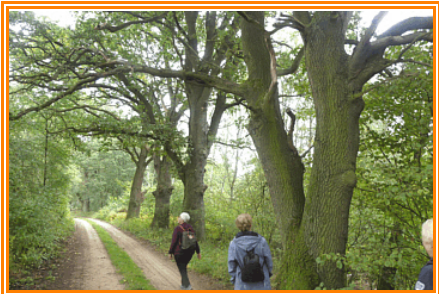
Abb.3: Stiel-Eichen als Baumreihe entlang des Weges südöstlich von Augustenberg

bildet. Je nach Jahreszeit kann man am Ackerrand verschiedene Kräuter sehen. Hier befindet sich auch ein Trafohäuschen. Dort biegen wir links ab. Auf den Weg, den wir nach etwa einen halben Kilometer erreichen, wandern wir auch an alten Stiel-Eichen ( Quercus robur ) vorbei.