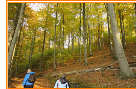
Abb. 4: Blick auf den Hang des NSG mit herbstlicher Belaubung

Im Wald ist die Rot-Buche ( Fagus sylvatica ) dominant. Besonders im Herbst zeigt sich der Buchenwald durch seine gelbe- bis rote Verfärbung des Laubes besonders attraktiv. An einigen lichten Stellen kann man auch größere Teile des Holzsees sehen. Dieser ist ein Klarwassersee, in dem man auch Armelechteralgen findet.