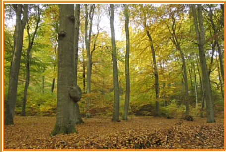
Abb. 6: Teilansicht der Naturwaldzelle am Stefansberg

Der Weg ist die Ostgrenze des NSG Kläden . Der Bereich um den Stefansberg ist die Kernzone der Naturwaldzelle des NSG und bereits zu DDR-Zeiten unter Schutz gestellt worden. Der Stefansberg ist von diesem Weg aus zu sehen. Auf diesem stehen neben Rot-Buche auch einige Gewöhnliche Fichten ( Picea abies ). Nach einigen Minuten erreicht man eine Tafel mit der Beschreibung der Naturwaldzelle.