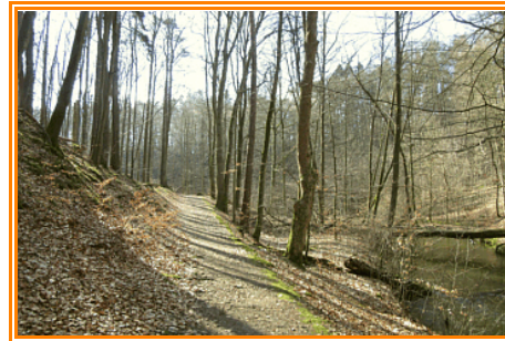
Abb. 2: Wanderweg an der Nordseite der Mildenitz (Rückwärtssicht)

"Schwarzer See". Dieser Weg ist, genau wie die Mildenitz , mehr oder weniger kurvenreich. Die Mildenitz fließt durch ein tief in die Umgebung eingeschnittenes Tal. Es sind auch Schautafeln im Mildenitztal aufgestellt. In diesen wird die Entstehung des Tales u.a. beschrieben. In Richtung Schwarzer See in der Nähe der Mildenitz gibt es eine Rastmöglichkeit. Diese ist nur ein kleines Stück von der beschriebenen Wanderroute entfernt.