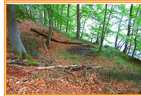
Abb. 3: Hangsickerquelle mit Winterschachtelhalm am Hang zum Holzsee

Der Wanderweg verläuft ab hier durch das Naturschutzgebiet. Mit stetig wechselnder Höhe zwischen Unter- und Mittelhang wandert man nur wenige Meter vom Ufer des Holzsees entfernt auf diesen Fußweg entlang. Auf diesen Abschnitt läuft man sowohl an bewaldeten Trockenhängen mit ausgeprägter Moosflora, als auch an Hangsickerquellen vorbei. An diesen Quellbereichen hat sich der Winter-Schachtelhalm ( Equisetum hyemale ) angesiedelt.