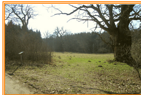
Abb. 7: Teilansicht der „Klädener Eichen“

Sieht man in Richtung Mildenitz kann man weitere alte Eichen sehen, wovon einige aufgrund des Zuganges zum Grundwasser noch leben. Vor der stärksten, bereits abgestorbenen Eiche steht ein Hinweisschild zu den „Klädener Eichen“ . Von hier aus sind es noch weniger als 400 m bis zum Rast- und Parkplatz.