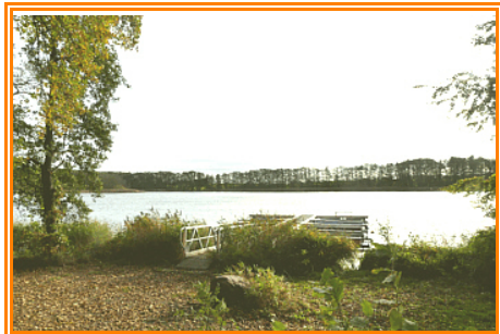
Abb. 3: Blick auf den Flachen Ziest mit kleiner Bade- und Boots-anlegestelle

Etwas später verlassen wir dieses Waldstück kurz vor dem Bahnübergang. Wir überqueren den Bahnübergang und biegen etwas später links in den Wald ein. Wir bleiben auf den Weg der bald rechts vor dem "Flachen Ziest" abbiegt. Nach wenigen Minuten haben wir eine kleine Badestelle mit Bootsstegen erreicht. Hier befindet sich auch eine kleine Schutzhütte.