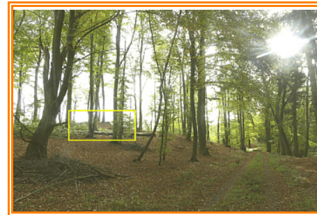
Abb. 4: Teilansicht des Hügelgräberfeldes (ein Grab markiert)

Von dort geht es einen breiten Waldweg entlang. Nach etwa 200m folgt rechts eine Wegeeinmündung, die wir erst einmal ignorieren (Route 536, 537). Einige Schritte weiter biegen wir links ab und gehen diesen Weg ( Route 537 ) bis zum Ende. Hierbei gehen wir an verschiedenen Waldbildern vorbei. Am Ende des Weges biegen wir rechts ab und bemerken auf der linken Seite eine merkliche Erhebung. Auf dieser Anhöhe befinden sich einige kleinere kegelförmige Erhebungen. Es handelt sich hier um Hügelgräber , wovon ein kleineres nicht vollendet zu sein scheint. Für Interessierende lohnt sich der kleine Aufstieg.