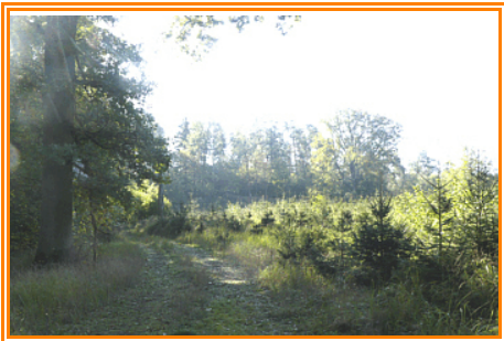
Abb. 7: Blick auf den Bäckerberg aus nördlicher Richtung

Wir folgen den Weg weiter, der in einer Senke nach links abbiegt. Dort steigt der Weg wieder an. Auf dem Plateau geht links vor eine Fichtenpflanzung ein Stichweg zum Bäckerberg (70m üNN). Hinter der Fichtenpflanzung sind auch einzelne Stieleichen erkennbar. Wer diese genauer sehen möchte kann diese auch besuchen.