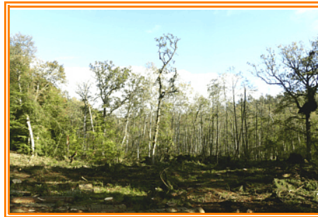
Abb. 6: Birken-Sumpfwald südlich der Bahnlinie Güstrow - Teterow und rechts des Wanderweges

Nordwestende des " Crivitzmoor ". Durch den Baumbewuchs ist es nicht überall einsehbar. Nach einigen Minuten erreichen wir eine Wegekreuzung. Wir überqueren diese, wobei wir auf der anderen Seite den Weg der etwas schräg verläuft erst einmal bergab gehen. Da im Herbst 2019 gerade Fällarbeiten stattgefunden haben, kann man rechts vom Weg ein nicht benanntes Birken-Sumpfwald erkennen. Diese liegt jedoch einige Meter vom Wanderweg entfernt.